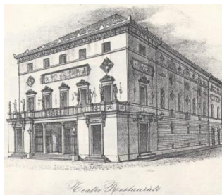
Teatro Sociale 1853 di A. Scala - Litografia