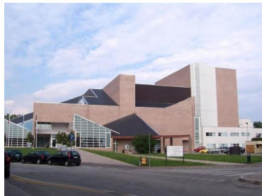
Teatro Nuovo Giovanni da Udine 1997